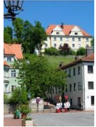
Pfarrhof auf dem Ruprechtsberg in Dorfen