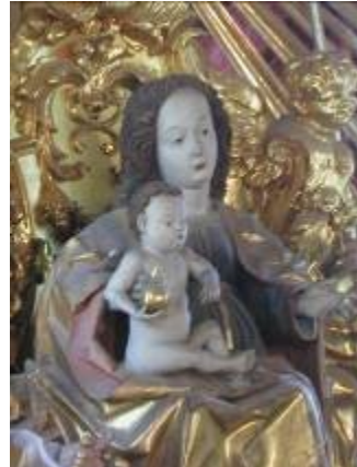
Gnadenbild am Hochaltar