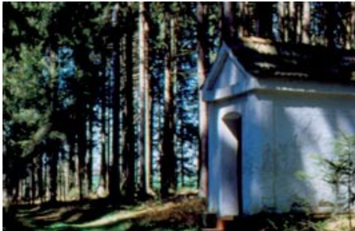
Foto: Kapelle bei Hofstätt